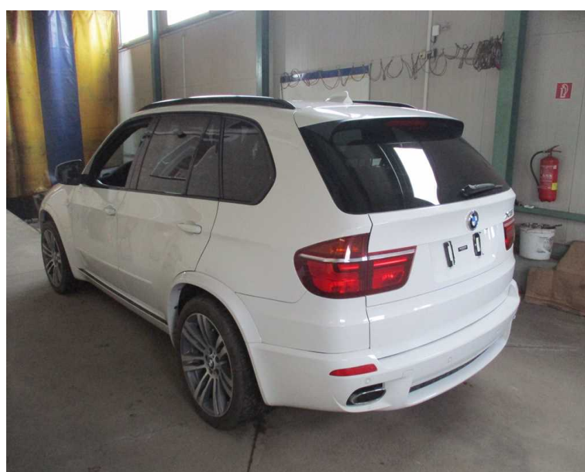
ľavá strana vozidla