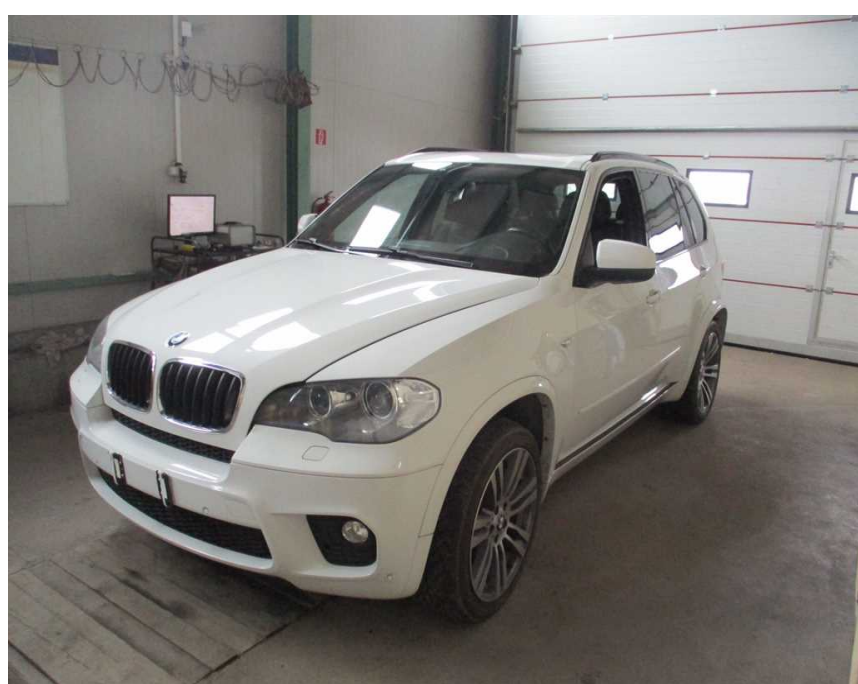
predná časť vozidla

PRE ZOBRAZENIE KOMPLETNEJ FOTODOKUMENTÁCIE Z KO POUŽITE QR KÓD, ALEBO WEBOVÚ ADRESU: fotodokumentácia_KO