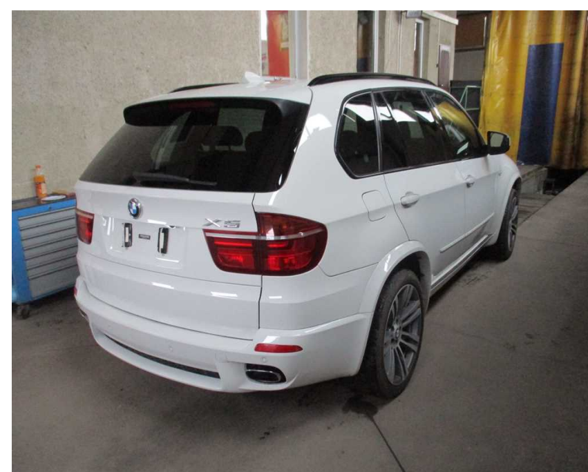
zadná časť vozidla