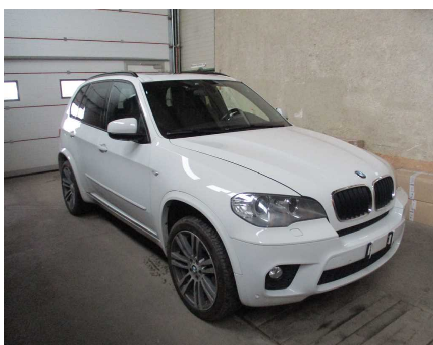
pravá strana vozidla